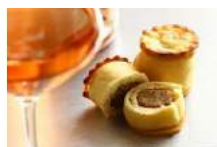
< Oreillettes / Bougnettes

L'oreillette ou bougnettes est un délicieux beignet parfumé à la fleur d'oranger. Autre savoureux dessert, c'est le surprenant petit pâté de Pézenas. Ce petit gâteau emblématique en forme de bobine contient une farce au goût atypique.