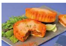
< Tielle à la sétoise